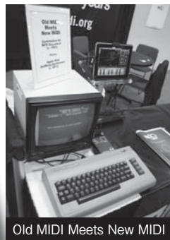
Old MIDI Meets New MIDI