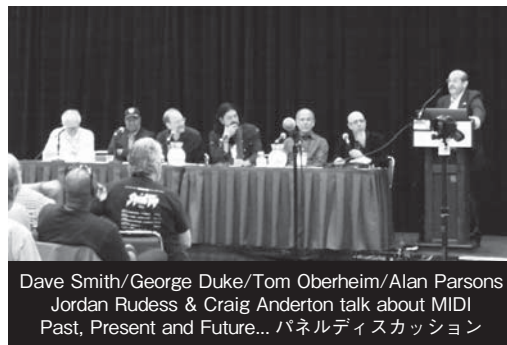
Dave Smith/George Duke/Tom Oberheim/Alan Parsons Jordan Rudess & Craig Anderton talk about MIDI Past, Present and Future... パネルディスカッション