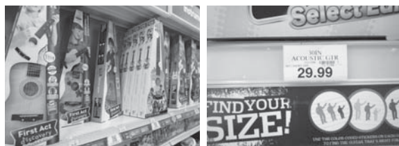
近くのトイザラス視察の写真 子供向けアコースティックギターが、$29.99 で売られている。

久々の海外出張でしたが、この NAMM ビジネスツアーに参加できたことで、何度も行っておられる方々に、NAMM の様子や、現地での過ごし方等、色々アドバイスを頂けたので、不安なく移動する事が出来ました。初めて NAMM に行く者にとっては大変安心できる企画でした。参加させて頂き、ありがとうございました。