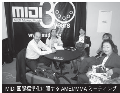
MIDI 国際標準化に関する AMEI/MMA ミーティング

MMA で進めている HD プロトコルについて、前日の総会後に MMA 会員外に対して行われたデモンストレーションについての総括、仕様の懸案事項に関する討議を