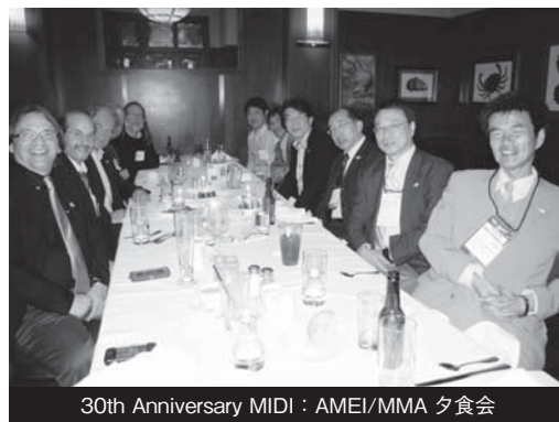
30th Anniversary MIDI : AMEI/MMA 夕食会