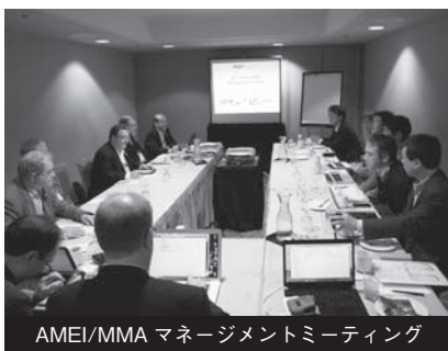
AMEI/MMA マネージメントミーティング