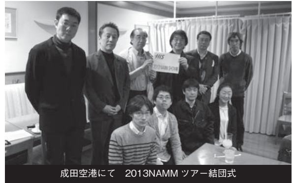
成田空港にて 2013NAMM ツアー結団式

定刻にロサンゼルス空港に到着、今回は通関もそれほどの混雑も無かったのですが、シンガポール航空のロサンゼルス便はもともと到着時刻が11:50と遅いので、チャーターしたバスに乗り込んだのは昼過ぎ、昼食を兼ねてファーマーズ・マーケットへ。ここはアナハイムへ行く途中立ち寄るのには都合の良い場所で、八百屋さん、フードコート、おみやげ屋さんなど165店以上がはいってるマーケットで、昼食に迷った時はここへ行く事にしています。食事後30分ほど散策して、これまた恒例となったハリウッドサインが(小さく)見えるコダックシアターの中庭へ。と思ったらドルビー・シアターに改名されていました。2012年コダックは破産法の適用を申請、ドルビー・ラボラトリーズが命名権を獲得し今後20年間はドルビー・シアターでアカデミー賞授賞式を行うそうです。今年もチャイニーズシアターやハードロックカフェの前では、トランスフォーマーやダースベイダーが手持ち無沙汰な様子で観光客と写真におさまっていました。その後は市場調査の定番ロサンゼルスギターセンターへ立ち寄り、夕方6時過ぎにアナハイムディズニーランドホテルへ到着しました。