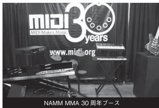
NAMM MMA 30 周年ブース